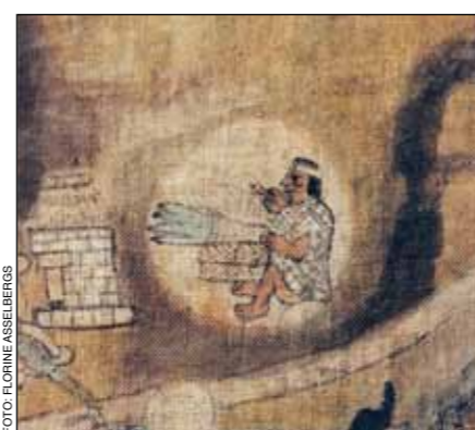
5. Glifo tianquiztli . Lienzo de Cuauhquechollan.