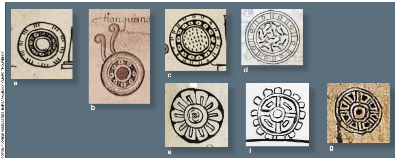
6. Topónimos con el glifo tianquiztli : a) Tianquizmanalco. Mapa de la Relación geográfica de Tetlitzaca . b) Tianquiznáhuac. Códice Cozcatzin , f. 6r. c) Xaltianquizco. Códice Mendoza , f. 16v. d) Tianquiztenco. Matricula de Huexotzinco , f. 541r. e) Pochtlan. Matricula de Huexotzinco , f. 525r. f) Pochtlan. Matricula de Huexotzinco , f. 695r. g) Pochtlan. Códice de Amecameca , f. 26r.

y la del Museum für Völkerkunde de Viena (MVK 43-380), miden respectivamente 67.5 cm y 70 cm de diámetro, dimensiones que se aproximan de manera sorprendente a las de los monolitos de la Sala Mexica.