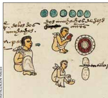
3. Glifo tianquiztli . Códice Mendoza, f. 59r.

Es claro que este pasaje describe el glifo tianquiztli dibujado en ese mismo capítulo (fig. 7) y que, por tanto, alude al tipo de monolitos que estamos analizando. Durán puntualiza ahí que dichas "piedras redondas" eran "tan grandes como una rodela". A este respecto, traigamos a la memoria que dos rodelas de plumas que han llegado a nuestros días, la del Museo Nacional de Historia de Chapultepec (MNH, inv. 10-92265)