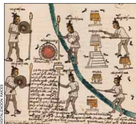
4. Glifo tianquiztli . Códice Mendoza, f. 67r.