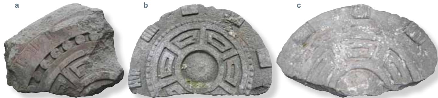
2. Fragmentos de esculturas semejantes al "Disco de Chalco": a) Sala Mexica, MNA (inv. 10-613271), 68 x 47.5 x 33.5 cm, procede de la calle de Guatemala. b) Sala Mexica, MNA (inv. 10-613272), 89 (diámetro) x 59.5 x 21.5 cm. c) Sala Mexica, MNA (inv. s.n.), 82.5 x 46 x 16 cm.