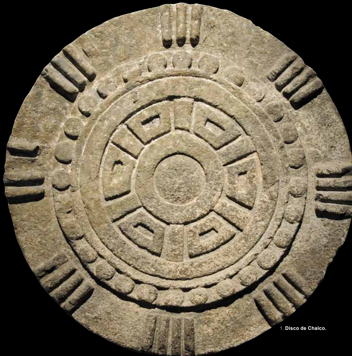
1. Disco de Chalco.

Es significativo que el glifo tianquiztli también fuera usado antiguamente en calidad de tezcacuitlapilli u ornamento especular que portaban los militares y las divinidades guerreras en la base de la espalda. Así lo vemos en la Sala Mexica: en el famoso monolito de Texcoco que, según los especialistas, representaría a Tonatiuh o a Coyolxauhqui (MNA, inv. 10-1142), y en la escultura central del conjunto de cinco guerreros neo-toltecas descubierto durante la construcción del Pasaje Catedral en la ciudad de México (MNA, inv. 10-48555). Esto va en consonancia con el sentido simbólico de “centralidad” propio de este glifo. Recordemos que los pochtecah , al igual